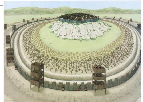
Une reconstitution du siège de l'oppidum d'Alésia, 52 avant notre ère. Les Romains creusent deux fossés. Sur le rempart, ils élèvent une haute palissade et des tours. Devant les deux fossés, ils dressent cinq rangées de branches d'arbres taillées en pointe. Ils disposent encore huit rangées de pieux en bois, plantés au fond d'un trou, leur pointe aiguë au feu dressée vers le haut.

52 avant Jésus-Christ : Le siège de l'oppidum d'Alésia. Défaite des Gaulois.