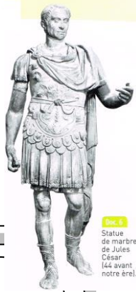
Statue de marbre de Jules César (44 avant notre ère).

Vercingétorix, chef Gaulois de la tribu des Arvernes contre Jules César, général Romain.