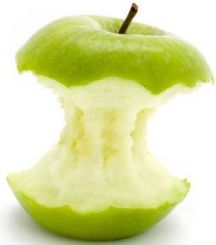
TROGNON DE POMME