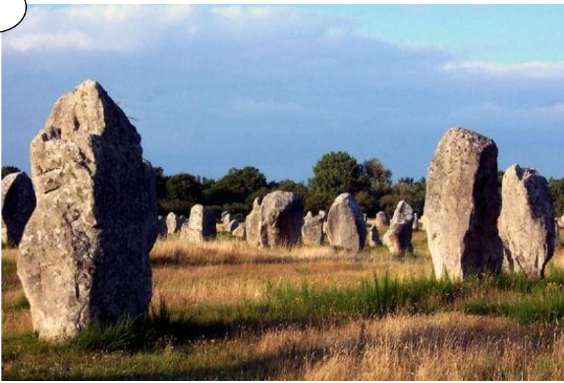
Les menhirs de Carnac