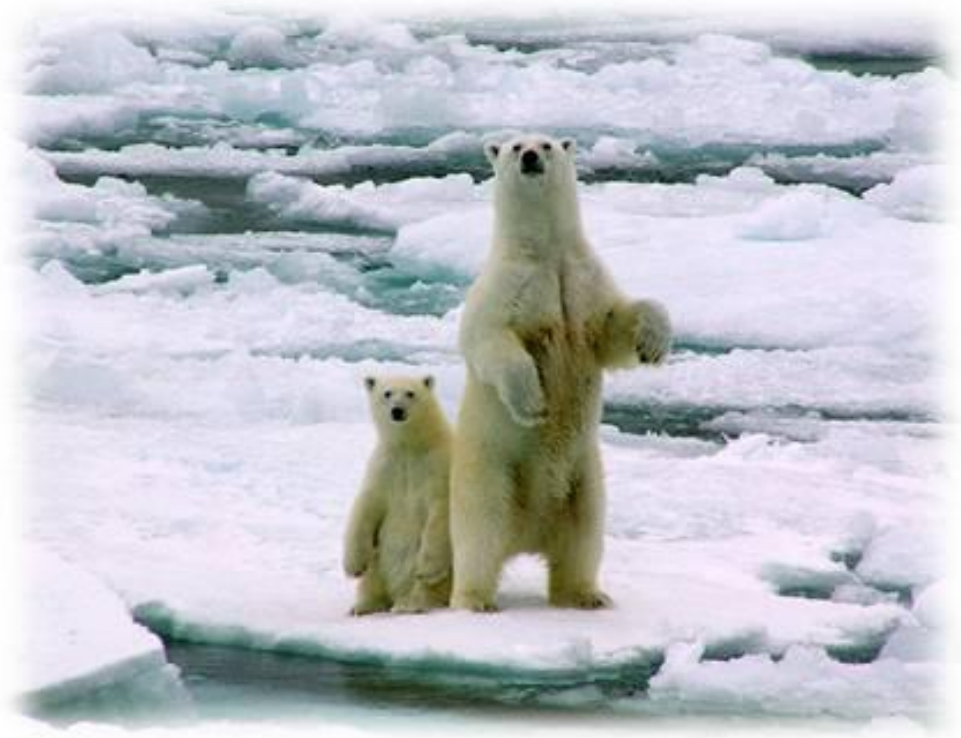
Des ours blancs sur la banquise