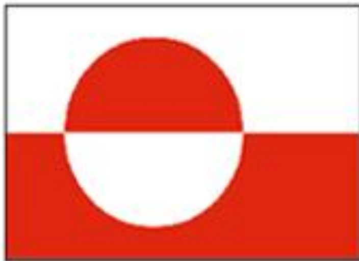
Le drapeau du Groënland, l'île blanche