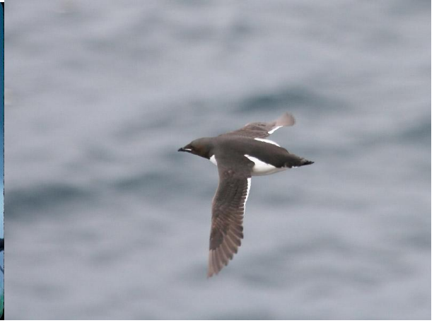
Les pingouins volants, les guillemots de Brünnich