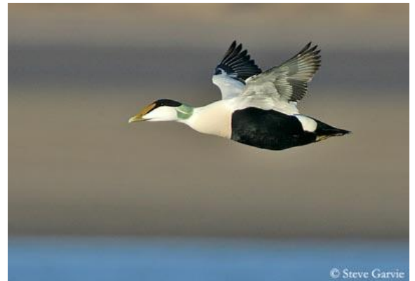
Un canard eider