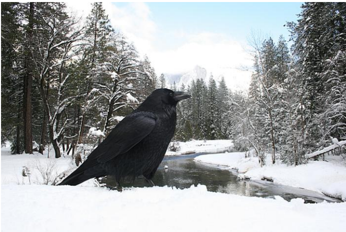
Un grand corbeau