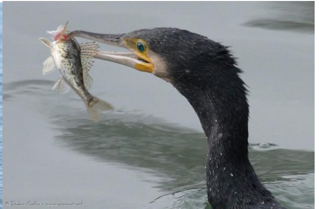
Un grand cormoran