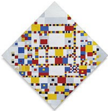
Victory, Boogie, Woogie, 1944