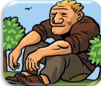
un gé an t