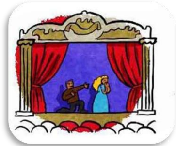
un th éâtre