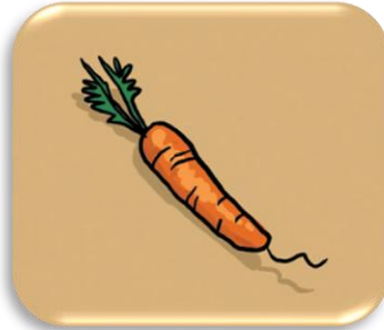
une car o tte