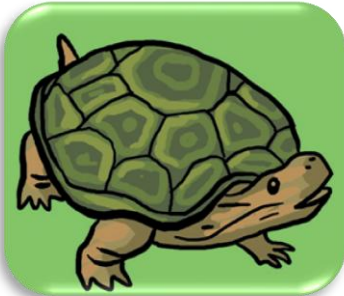
une t ortue

J'écris le plus souvent t , ou quelquefois tt ou th .