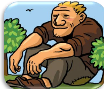
un gé an t