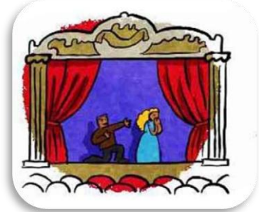
un th éâtre