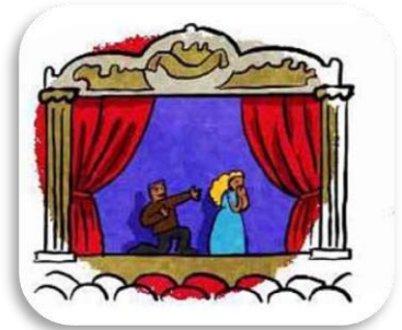
un th éâtre