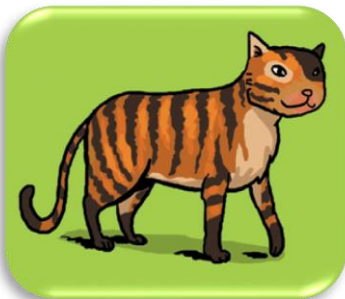
un ch at

Je vois t , mais je n'entends pas le son [ t ]