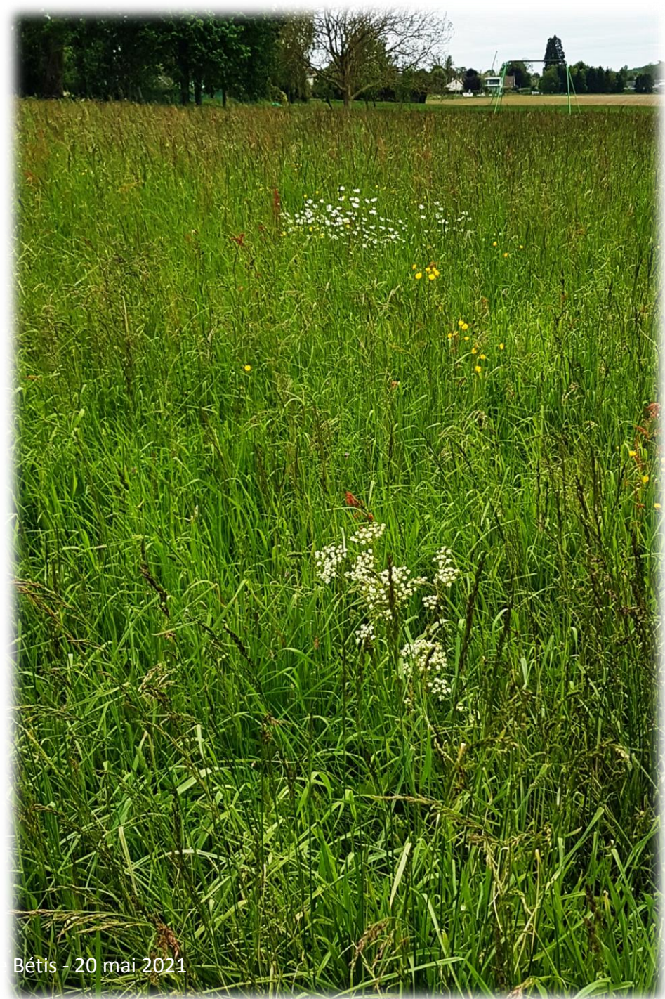
Montage d'Eméranc Bétis - 20 mai 2021