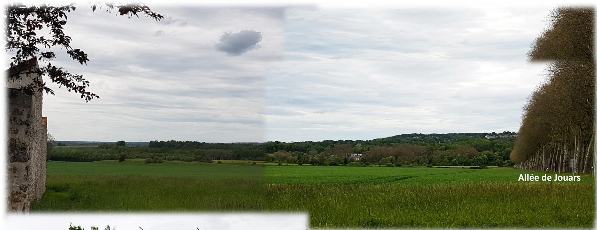
Allée de Jouars