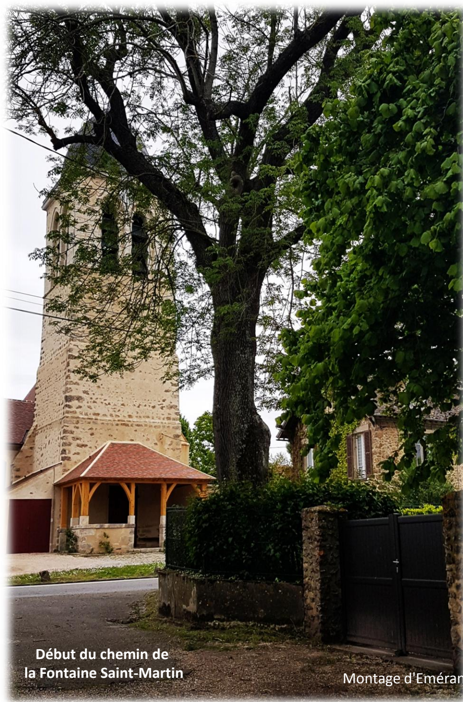
Début du chemin de la Fontaine Saint-Martin