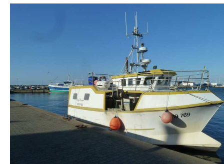
Le Gulf Stream

Il est toutefois possible à ceux qui le souhaitent de nous rejoindre en cours de saison pour les distributions restantes.