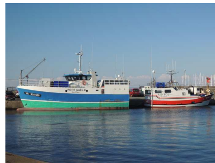
Le Petit Gaël II et le Bad Boy

Il est possible de prendre plusieurs colis par contrat.