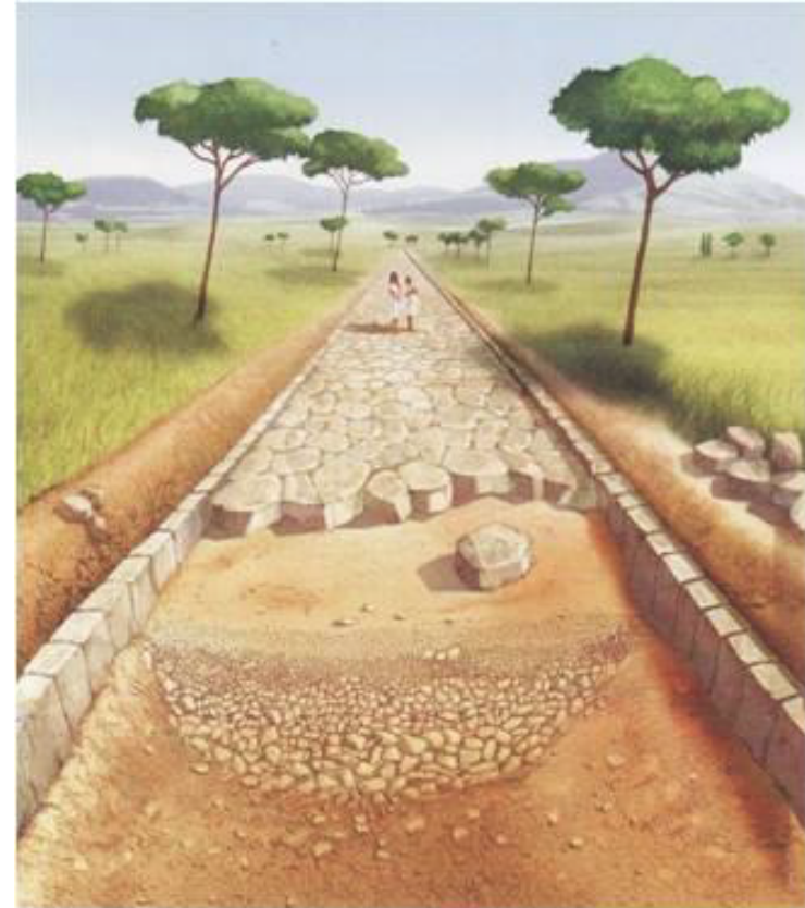
Coupe d'une voie romaine