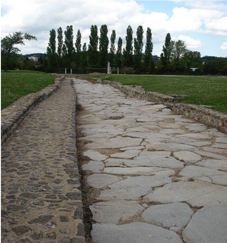
Voie romaine à Saint-Romain-en-Gal