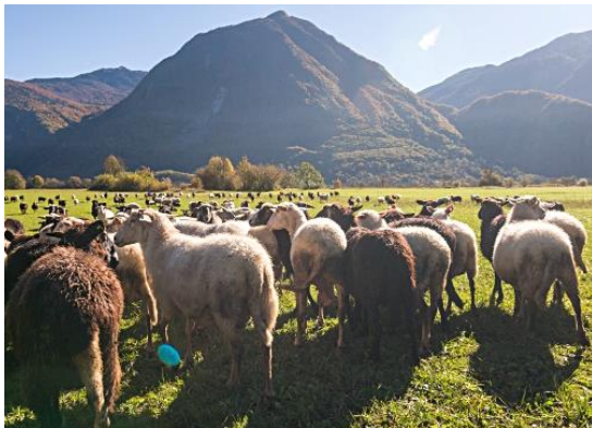
Photo dans son milieu de vie