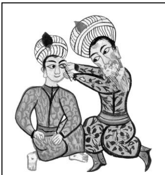
1 - Opération de la cataracte. Miniature turque du XVe, BNF, Paris.

La Mecque était un grand centre de commerce réunissant le Sud au Nord de la Péninsule, exportant des dattes, des épices, des aromates (les parfums d'Arabie), de la soie et tous autres raffinements en provenance du lointain Orient. 2 - www.basile-y.com/islam/isl1a.html