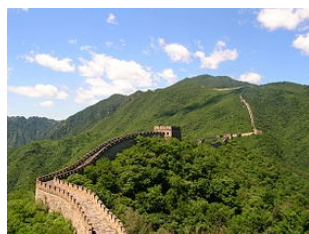
la grande muraille de Chine

Parmi les monuments, on trouve la grande muraille de Chine (le plus long monument au monde), la cité interdite ou encore le mausolée de l'empereur Qin avec les milliers de soldats en terre cuite qui veillent sur son sommeil.