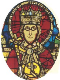
Vitrail de la cathédrale de Strasbourg, XII e siècle.

Quelques temps après la mort de Pépin le Bref en 768, son fils Charlemagne s'empare du pouvoir et poursuit les conquêtes territoriales de son père.