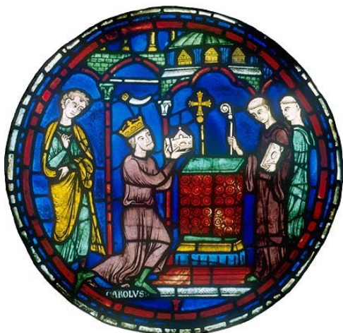
Charlemagne offrant des reliques à l'église d'Aix-la-Chapelle Vitrail de la cathédrale de Chartres, XII e -XIII e siècle

Décris la position de Charlemagne. Que montre-t-elle ?