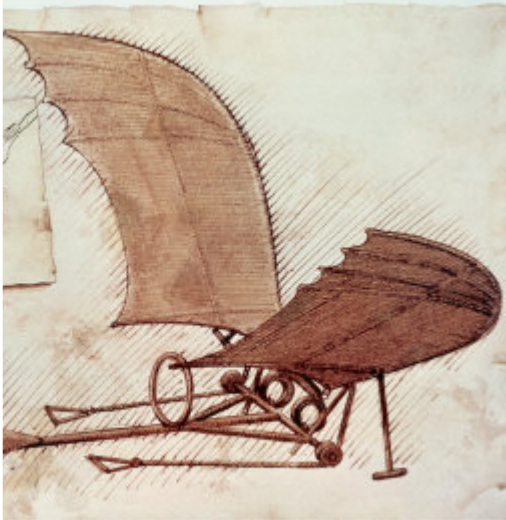
L. De Vinci - 1500 1ers dessins de machines volantes