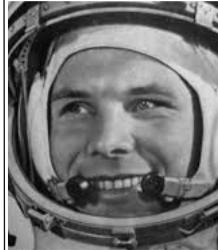
Gargarine- 1961 1er homme dans l'espace