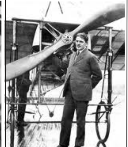
Blériot - 1909 Traversée de la Manche