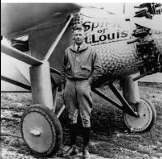
Lindbergh - 1927 Traversée de l'Atlantique