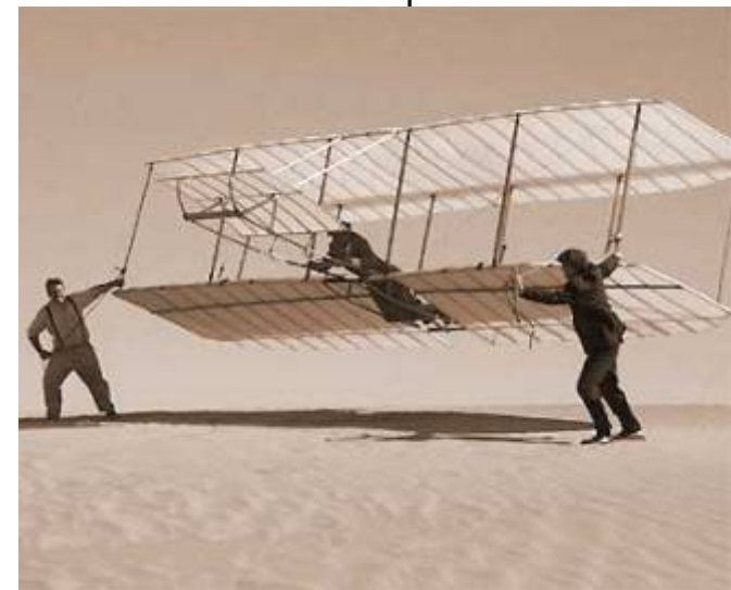
Frères Wright - 1903