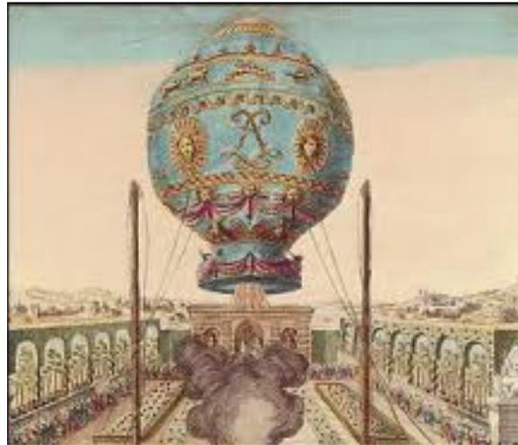
1er vol de montgolfière - 1783