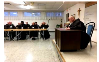
Lundi 23 avril 2018—Québec : Première soirée du Chapitre des nattes de tous les OFM du Canada. Plein d'amitié et d'accueil mutuels.

Dans le processus de préparation à la fondation de la nouvelle province canadienne, plusieurs comités ont été formés: mission et évangélisation, formation et études, finances, statuts, communications et liturgie. Ces comités travaillent conjointement avec les définitoires existants, ainsi qu'avec un comité de transition (chargé de l'organisation du Chapitre d'union et du Chapitre des nattes) et un délégué général. Tous les frères ont été invités à participer au processus de discernement concernant le nom de la nouvelle province. »