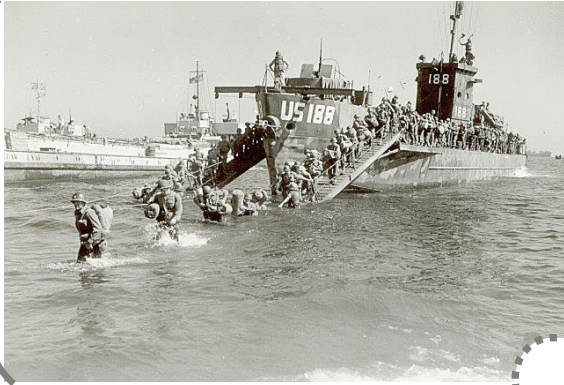
Débarquement des Américains en 1944