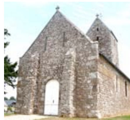
église Notre-Dame de La Godefroy #

N'ayons pas peur des catastrophes, des guerres, des bouleversements de notre monde du travail, de l'enfantement. Si nous mettons notre foi en toi Seigneur tu sais nous rassurer. Que la bonne nouvelle de ton Royaume qui vient nous donne de persévérer avec charité dans l'espérance sainte.