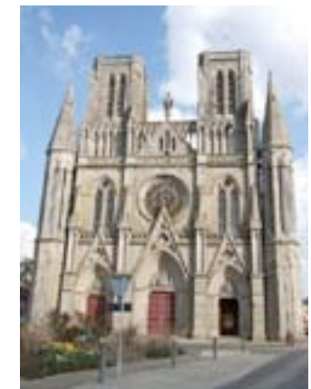
église Notre-Dame des Champs #

Paroisse : Saint-Aubert d'Avranches tel : 02 33 58 04 45