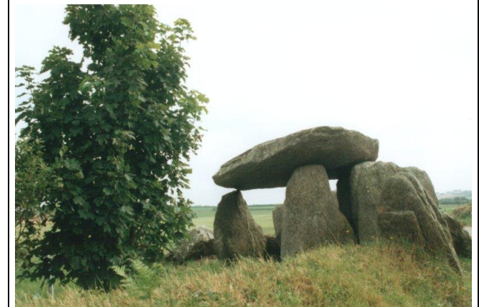
Dolmen 3000 ans av. J.C.