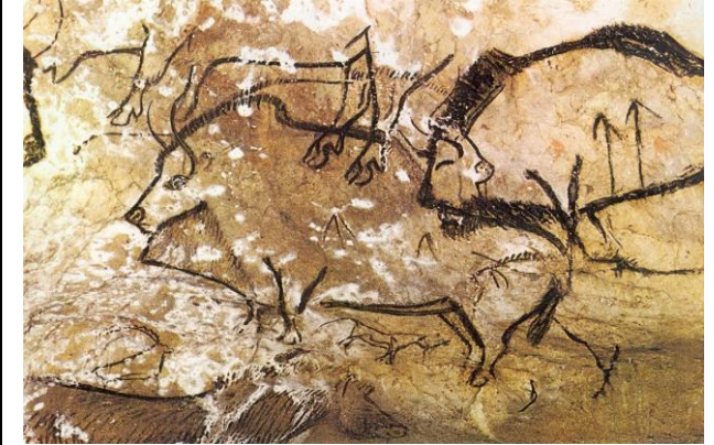
Peintures de la grotte de Niaux 11 000 ans av. J.C.