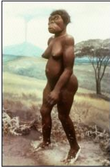
Lucy (reconstitution) 3,5 millions d'années av JC)