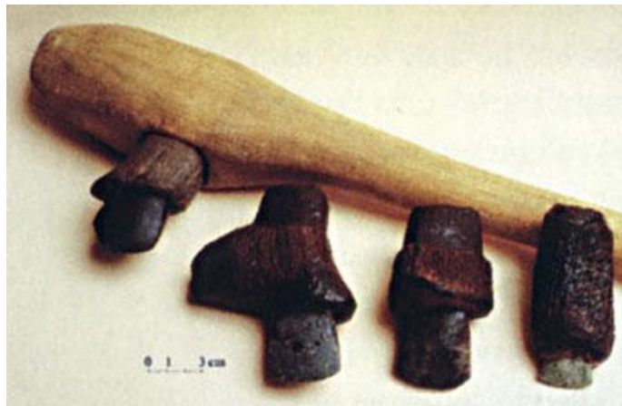
Hache en pierre polie (3000 ans av JC)