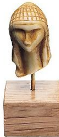
Statuette : Dame de Brassempouy (23 000 ans av JC)