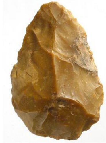
Biface taillé (80 000 ans av JC)