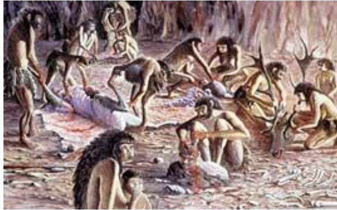
Grotte de Tautavel (500 000 ans av JC)