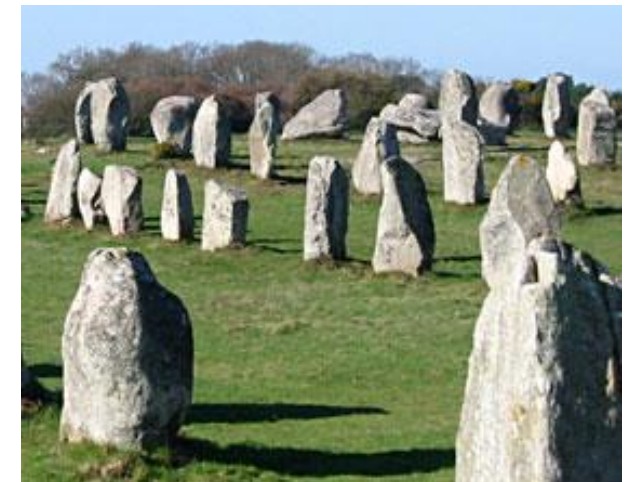
Menhirs de Carnac (3000 ans av JC)