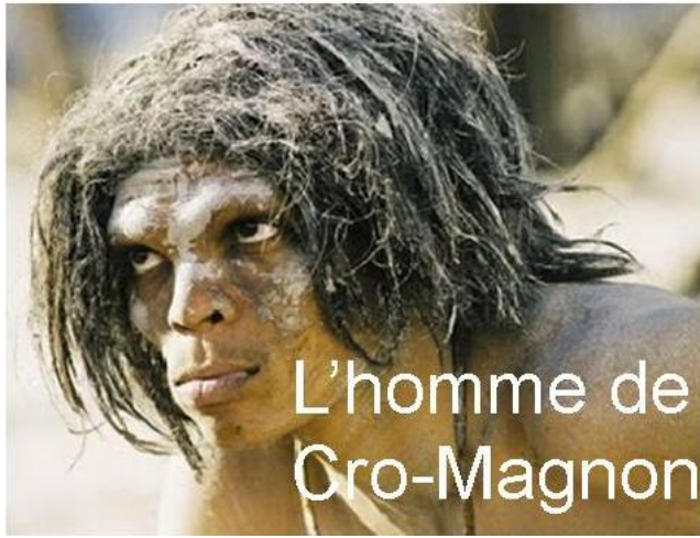
Homme de Cro Magnon