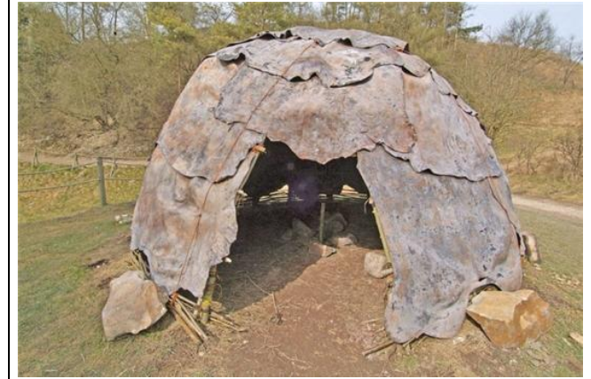
Tente en peaux (reconstitution) 12 000 ans av JC