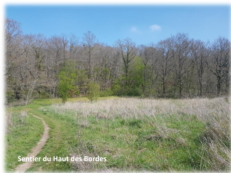
Sentier du Haut des Bordes