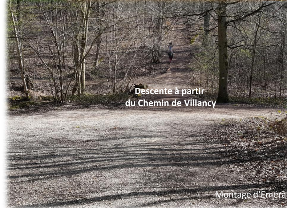
Descente à partir du Chemin de Villancy