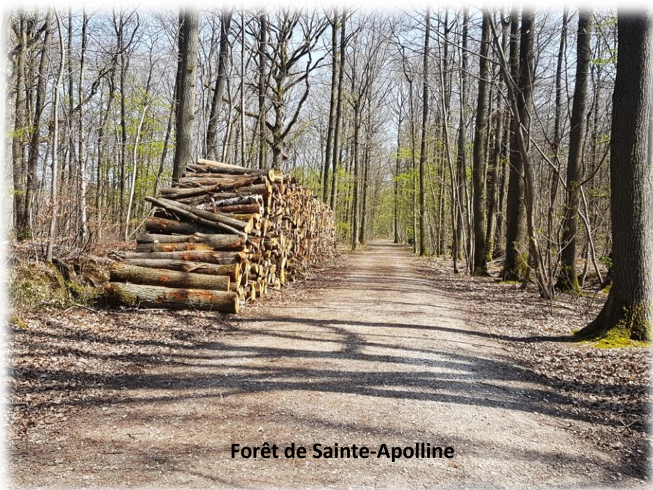
Forêt de Sainte-Apolline