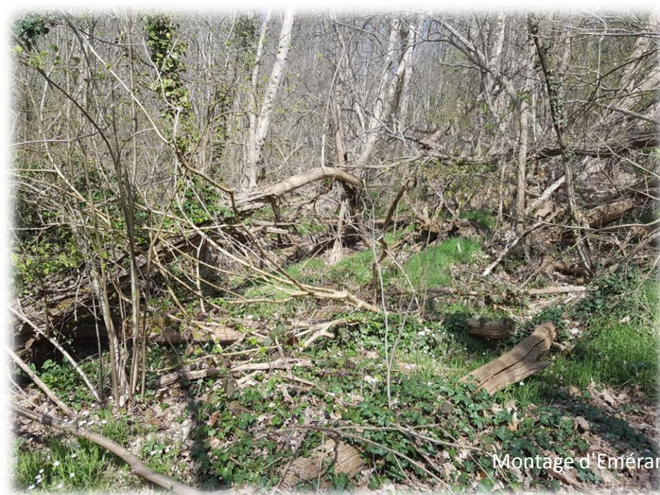
Montage d'Emerance Bétis - 4 avril 2021