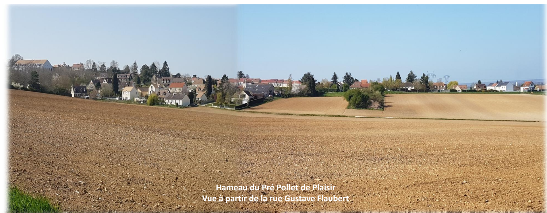
Hameau du Pré Pollet de Plaisir Vue à partir de la rue Gustave Flaubert