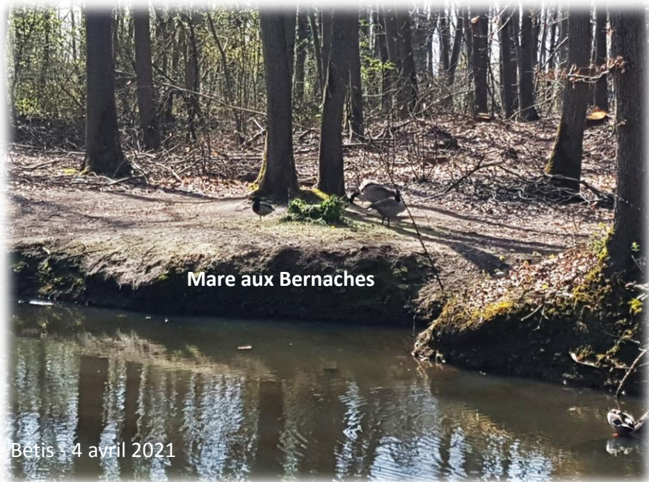
Mare aux Bernaches