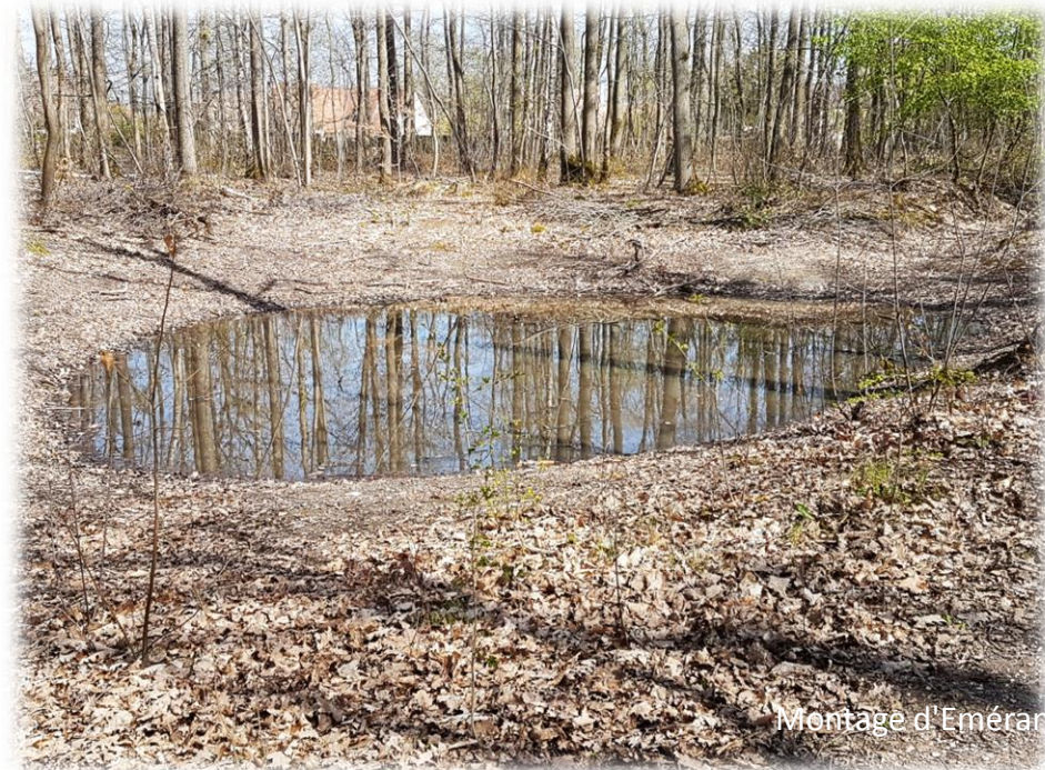
Montage d'Émerance Bétis - 4 avril 2021