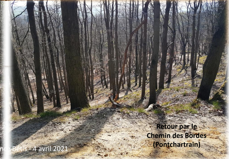
Retour par le Chemin des Bordes (Pontchartrain)