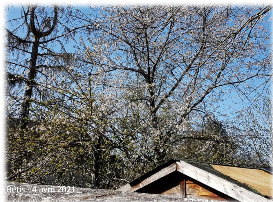
Montage d'Émerance Bétis - 4 avril 2021