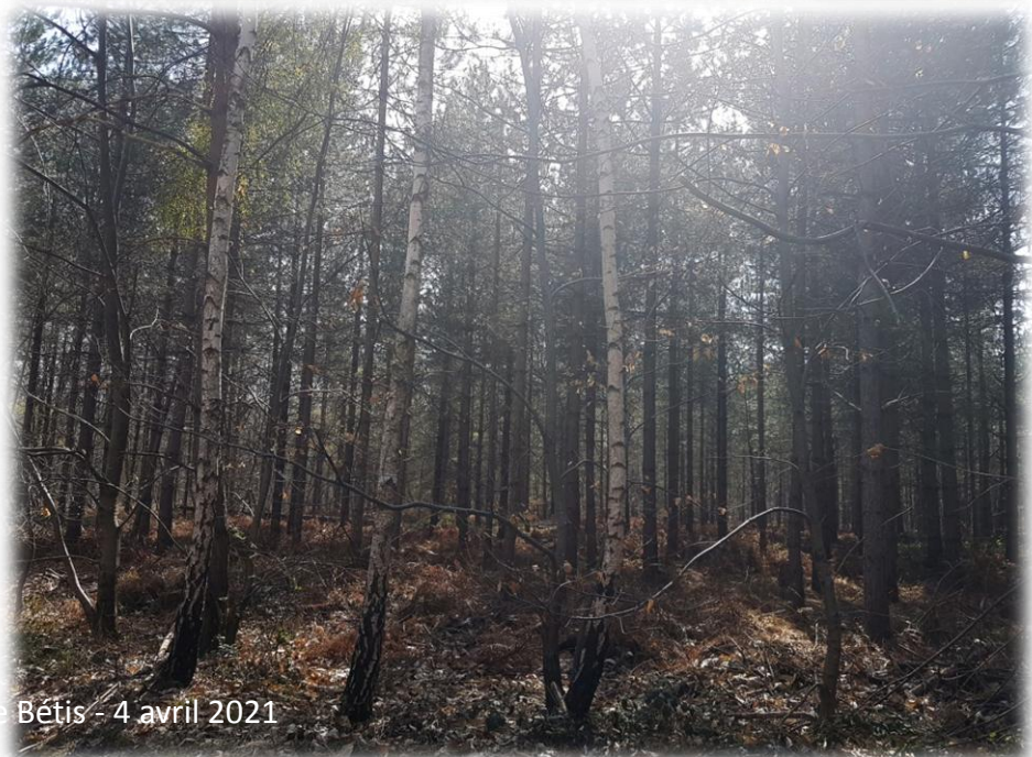
Montage d'Emerance Bétis - 4 avril 2021