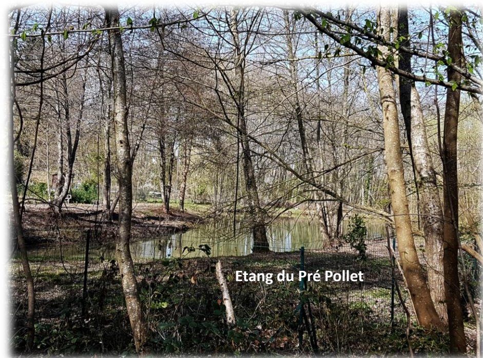
Etang du Pré Pollet