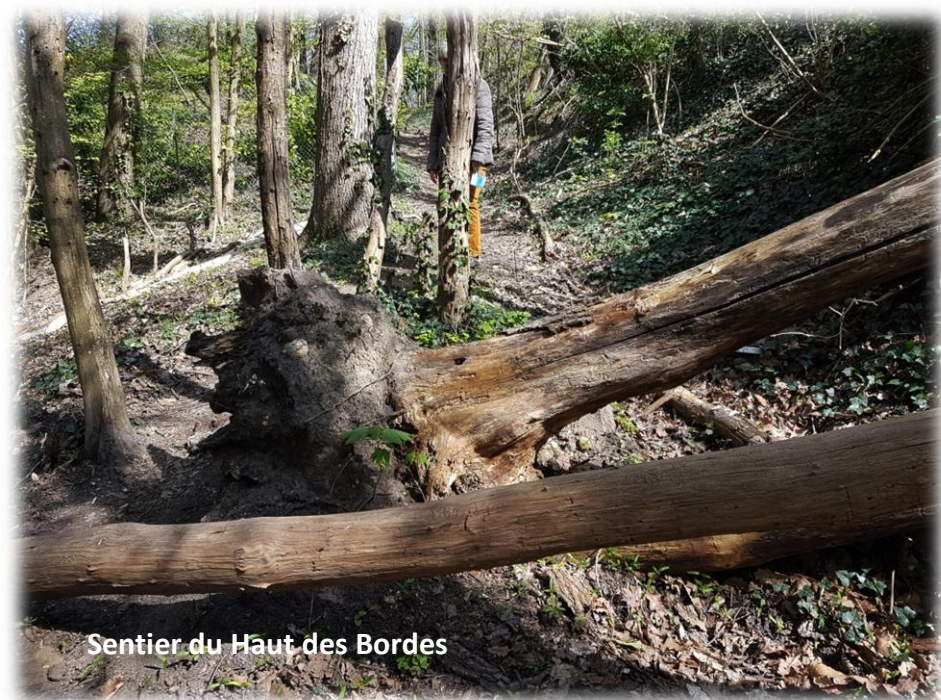
Sentier du Haut des Bordes