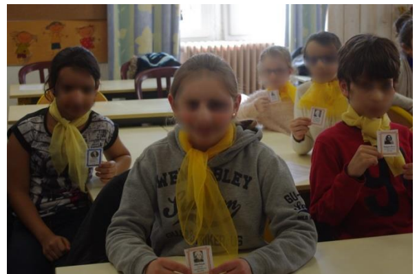
5 Représentants du clergé