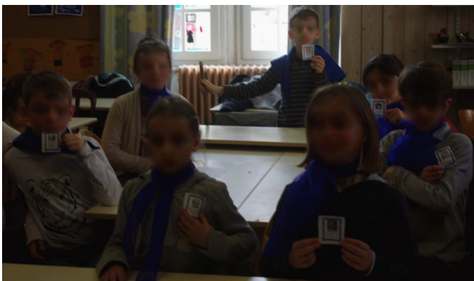
7 Représentants de la noblesse

CODES COULEURS Echarpes bleues : La NOBLESSE / jaune : Le CLERGE / rouge : le Tiers-Etat