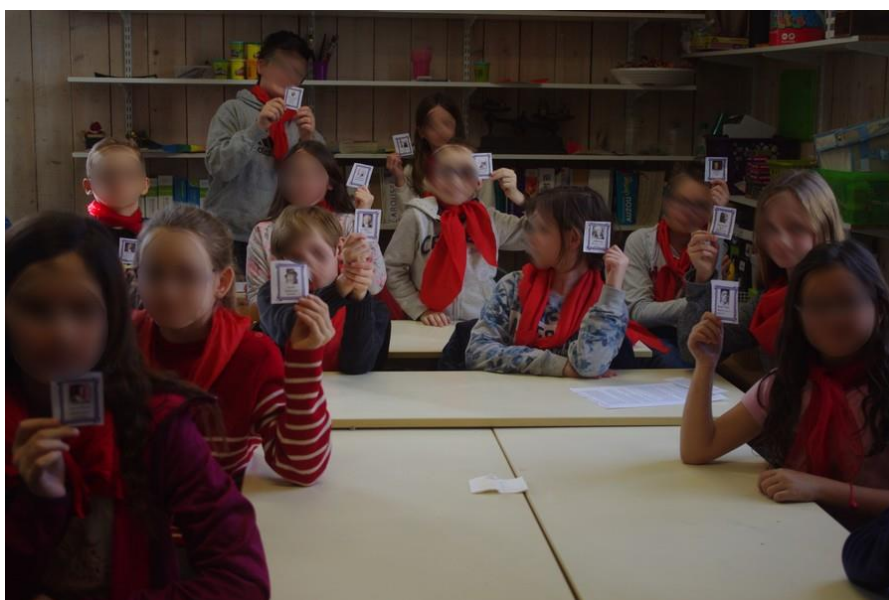
14 représentants du Tiers-Etats