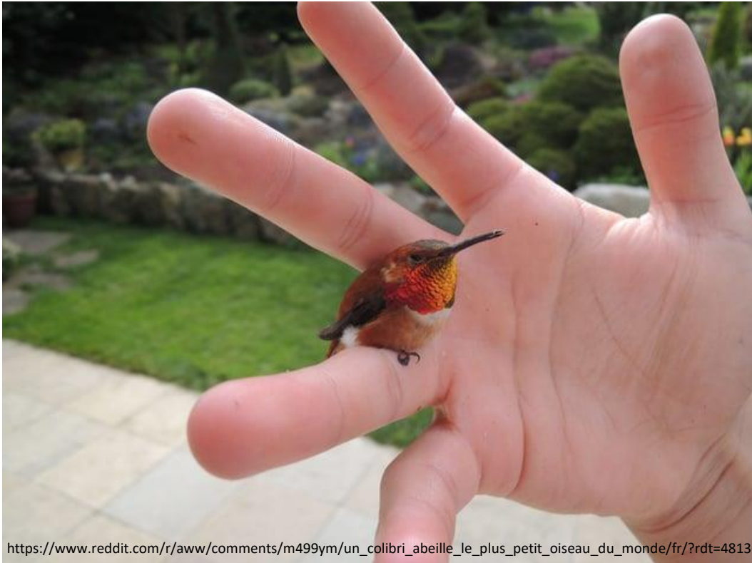
Le Colibri roux

Il bat des ailes très vite ce qui lui permet de voler dans tous les sens, même en arrière ! Il peut aussi faire des vols stationnaires.