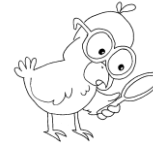
Illustration de l'exemple (si possible):