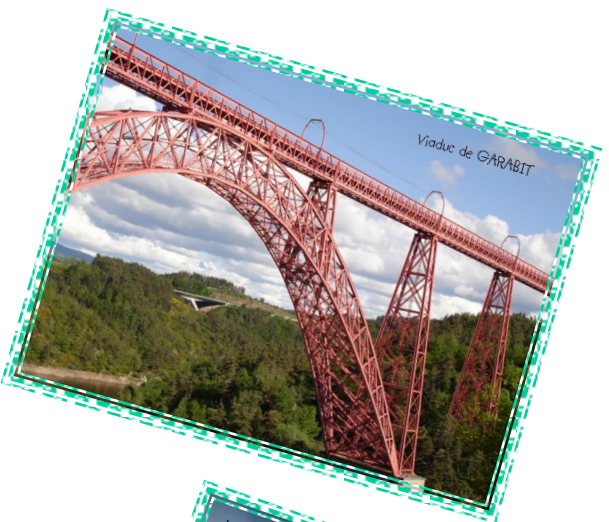
Viaduc de GARABIT