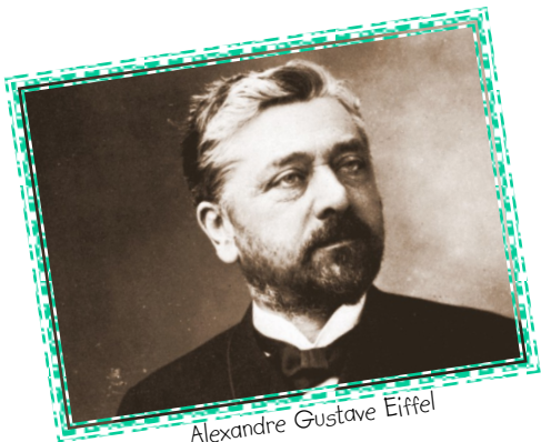
Alexandre Gustave Eiffel

Parmi ses travaux les plus célèbres, Gustave Eiffel a réalisé la tour Eiffel ( Paris ) ainsi que l'ossature métallique de la statue de la Liberté ( New York ).