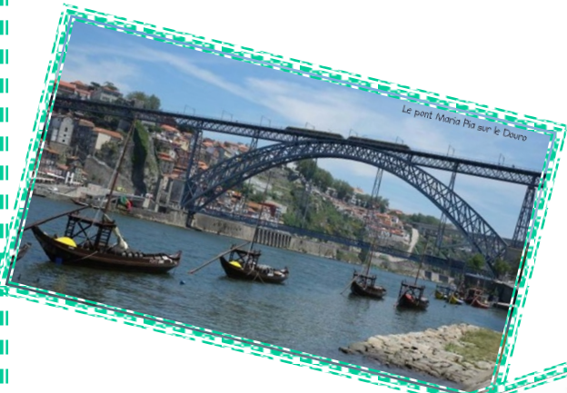
Le pont Maria Pia sur le Douro