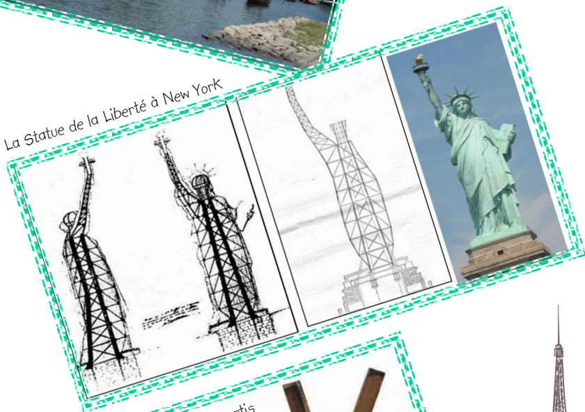
La Statue de la Liberté à New York