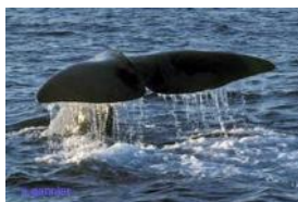
Escale des navigateurs et des baleines

L'île des Açores sera la destination privilegié de nos communes en 2013