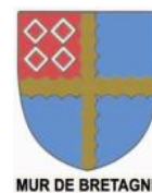
MUR DE BRETAGNE

C'est dans le cadre du programme de santé « Vivre en forme », lancé en 2010, que la ville a distribué aux 1400 élèves de la commune une boîte hermétique réutilisable. Ses dimensions, soigneusement étudiées, sont prévues pour y éviter d'y déposer des aliments tel que chips ou canettes de soda. Y est également jointe, à l'intérieur, une plaquette informative pour les parents.