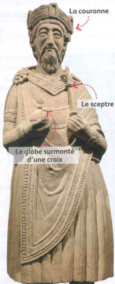
1 Charlemagne, le roi des Francs (768) Statue de Charlemagne, monastère de Saint-Jean-Baptiste de Müstair (Suisse), IX e siècle.