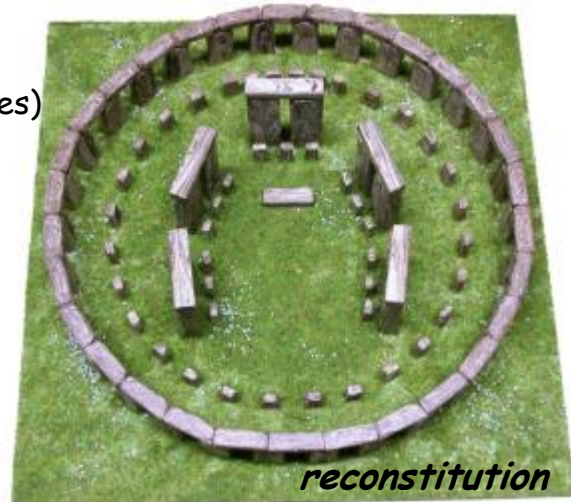
taille de l'œuvre

Auteur : Inconnu Période d'activité : Du Néolithique (âge des pierres polies) à l'Âge de bronze Titre : Stonehenge Date de création : entre -2 800 et - 1 100 Dimensions : plus de 9 mètres de haut et 50 m de long Technique : Ensemble de pierres posées Lieu d'exposition : Solisbury en Angleterre