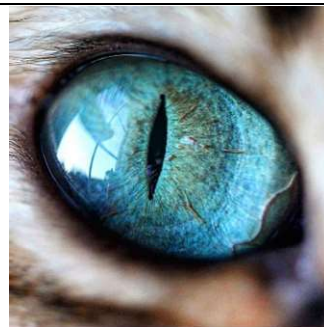
10 : un œil de chat