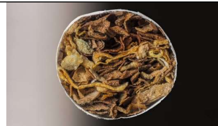
11 : une cigarette