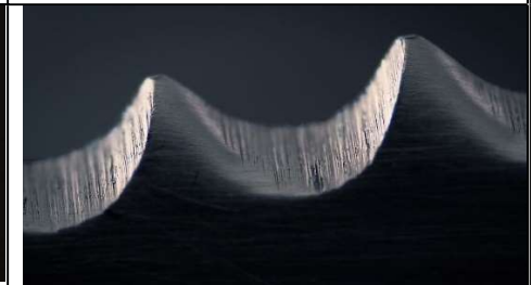
12 : les dents d'un couteau