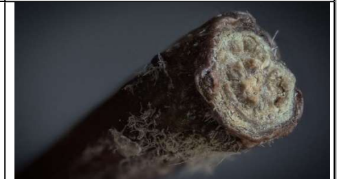
8 : une queue de pomme