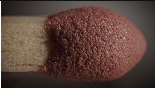
1 : une allumette