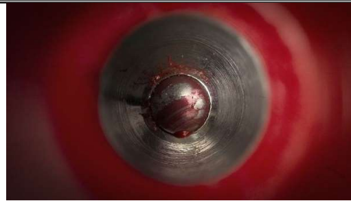
2 : un stylo à bille