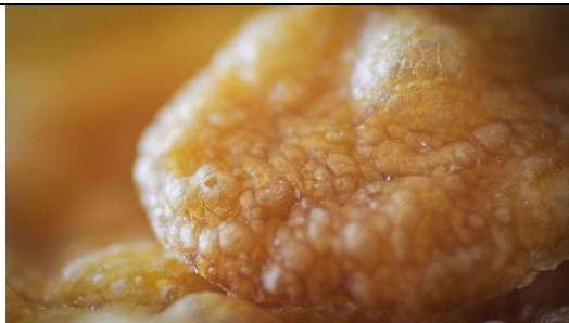
9 : un corn-flake