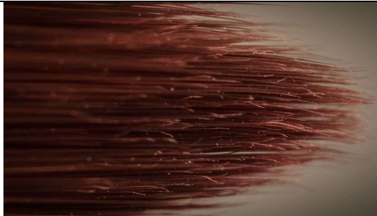
5 : des poils de pinceau