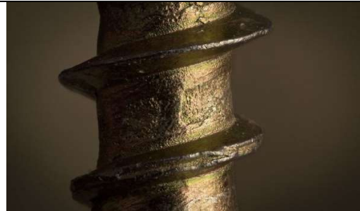
6 : une vis