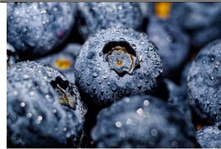
3 : des myrtilles