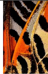
7 : une aile de papillon