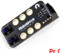
Détecteur de ligne