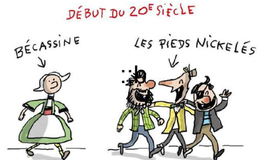
Becassine et les pieds Nickelés

BECASSINE: C'est la première BD avec les pieds nicklés mais se qui était bizarre c'est que se n'était pas représenter de la même façon que de nos jours (le texte était en dessous de l'illustration)