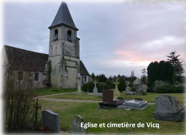
Eglise et cimetière de Vicq

Extrait article n°504 de novembre 2012 de la revue Archéologia.