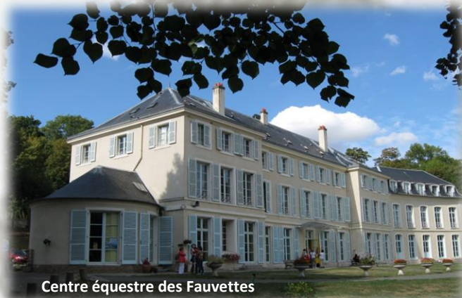
Centre équestre des Fauvettes

Le portail a deux vantaux. Daté de 1860, il est orné d'un bas relief représentant l'annonciation. Beaux vitraux : celui de Ste Rosalie, de 1866, offert par Edouard Brame. L'œuvre a été réalisée d'après les cartons d'Ingres ou de Flandrin.