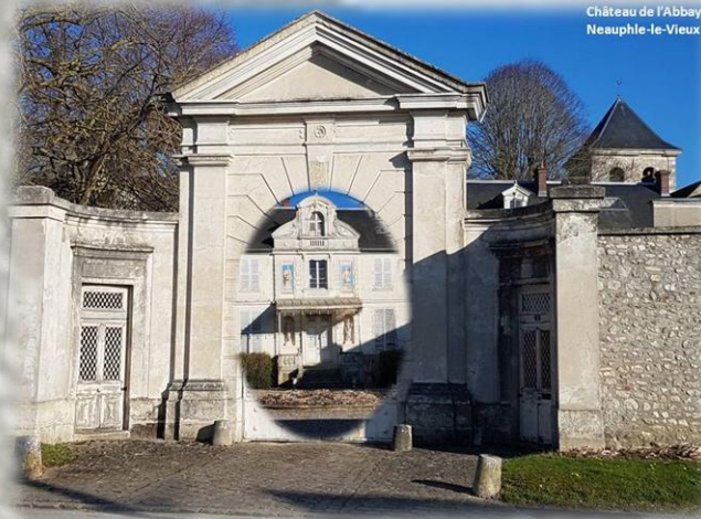
Château de l'Abbaye Neauphle-le-Vieux

3 On a retrouvé la 7 ème compagnie (1975). Scène du trio repris par les Allemands. à 1h05min30sec Téléfilm «C'est pas de l'amour» de Jérôme Cornouau (2013).