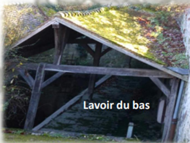
Lavoir du bas

Réalisé en bois et en pierre au XIX e siècle avec un toit à deux pentes, il est situé sur le cours du Lieutel.