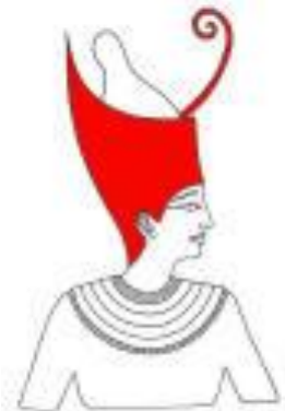
La double couronne (le pschent) symbolise le pouvoir du pharaon sur les deux Terres (Basse et Haute-Egypte