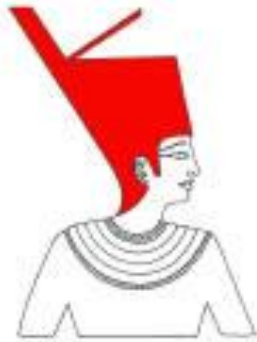
La couronne rouge pour la Haute Egypte