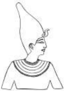
La couronne blanche pour la Basse Egypte