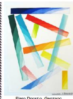
Piero Dorazio, Genzano.