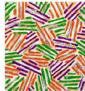
Jasper Johns, Crosshatch, 1977.