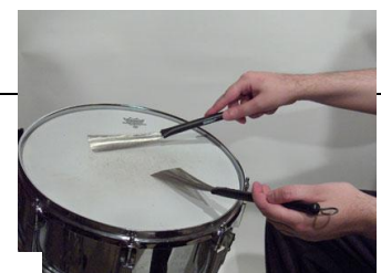
Balais de batterie