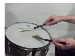
Balais de batterie

Le morceau débute sur un jeu de balais de batterie, accompagné par un chœur féminin et une guitare acoustique puis électrique, jusqu'à l'apparition des violons qui marquent l'envol du morceau jusqu'à son climax, avant une chute douce accompagnée par le chœur.