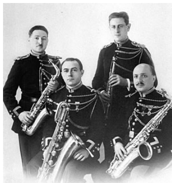
Quatuor de Saxophone de la Garde Républicaine, 1927

À l'origine, le saxophone est un instrument utilisé par les fanfares ou la musique militaire.