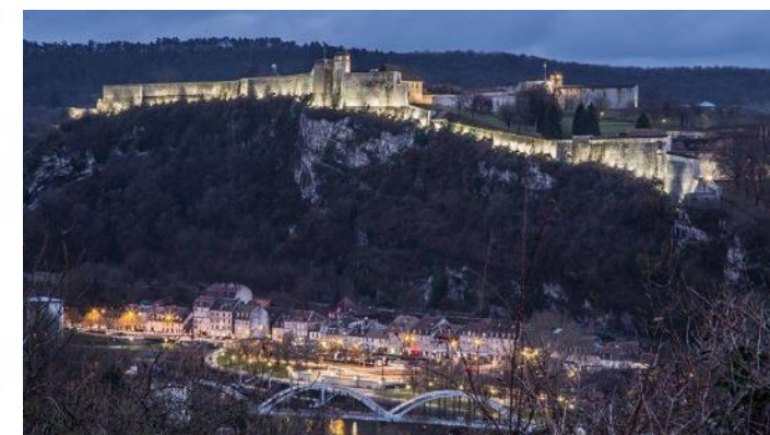
Citadelle de Besançon Patrimoine mondial de l'Unesco