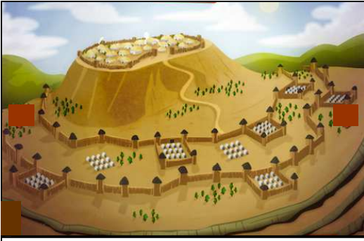
Doc 3 : Reconstitution de la double fortification* romaine autour d'Alésia.