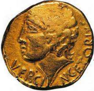
Doc 5 : Vercingétorix, (72-46 av. J.-C.), pièce de monnaie d'or, 1er siècle av. J.-C.