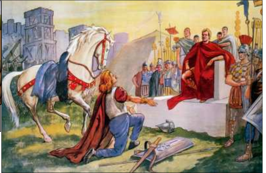
Doc 4 : Vercingétorix se rend à Jules César à Alésia en 52 av J.C.