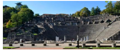
Théâtre romain de Lugdunum (Lyon)