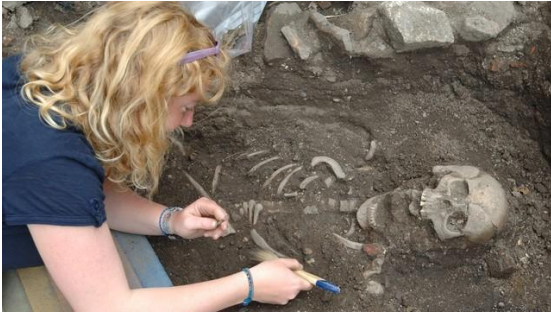
Une archéologue découvre un squelette préhistorique.