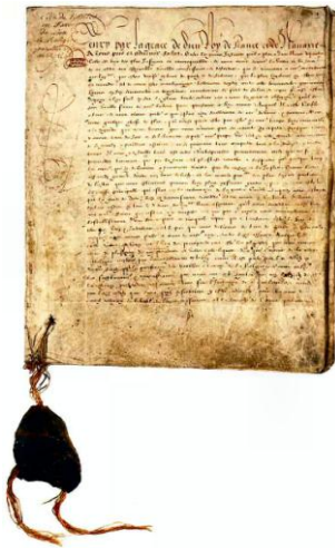
Edit de Nantes (13 avril 1598) met fin aux guerres de religion