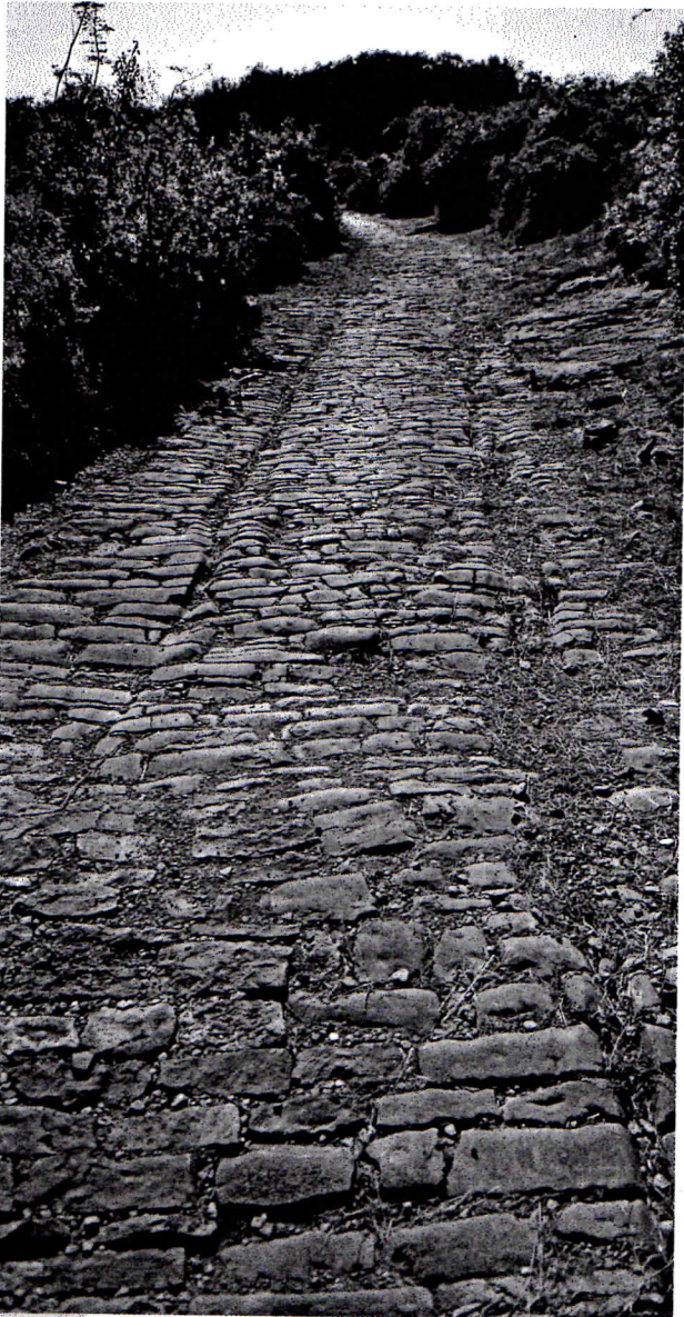
DOC. 1 Une voie romaine (commune de Villetelle, Hérault).

observe ces documents et donne leur carte d'identité