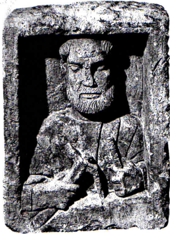
D Un tonnelier (2 e siècle).

La population de Vesontio passe une grande partie de son temps libre à l'amphithéâtre. Elle y assiste à des scènes de chasse, à des combats d'animaux ou de gladiateurs.