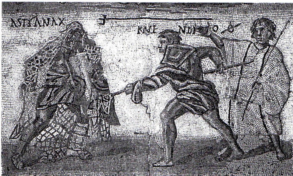
G Des gladiateurs dans l'arène (4 e siècle).