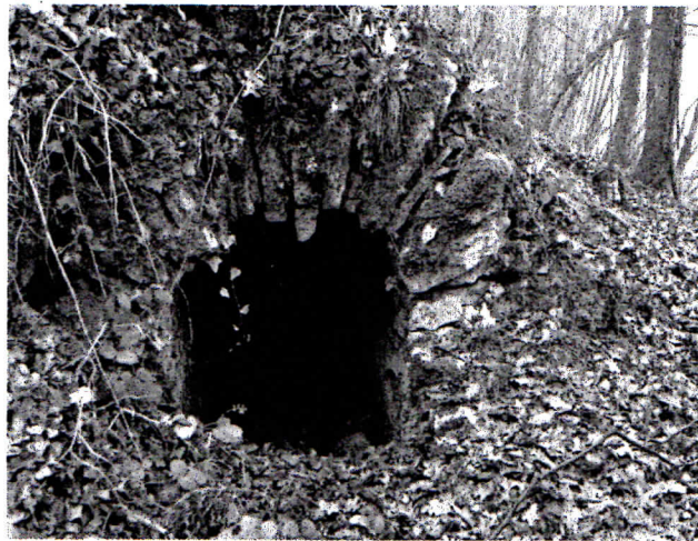
J Conduit maçonné et voûté amenant l'eau à Vesontio (1 er - 2 e siècles).

Le théâtre a la forme d'un demi-cercle fermé par un mur orné de statues, de colonnes, de motifs servant de décor aux spectacles. Sur la scène, les comédiens jouent des pièces, chantent, dansent, miment, disent des vers.