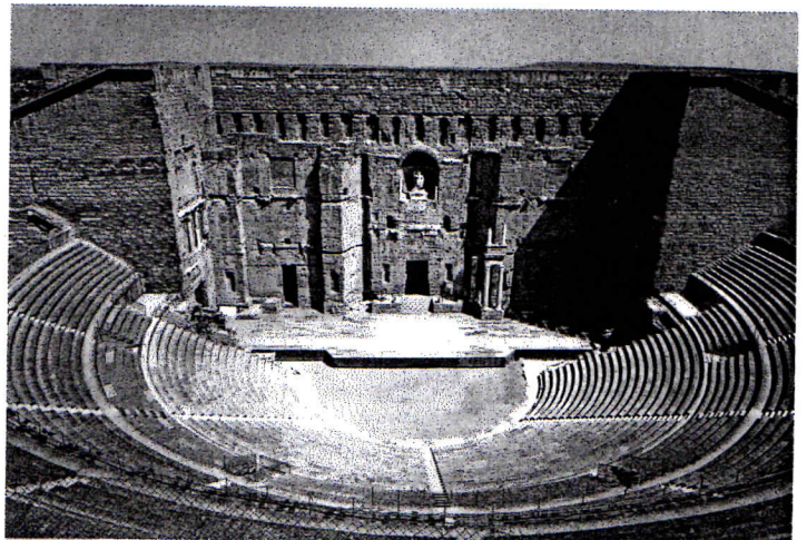
DOC. 3 Théâtre romain du 1 er siècle à Orange.