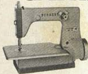
PEGASUS. Une Machine un Fil