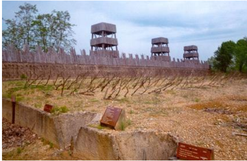
Doc A : les fortifications d'Alésia