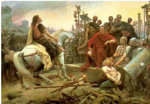
Doc B : Vercingetorix se rend à César