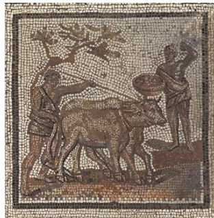
Pavage de mosaïque représentant un "calendrier rustique"

Saint-Germain-en-Laye, musée d'Archéologie nationale et Domaine national de Saint-Germain-en-Laye