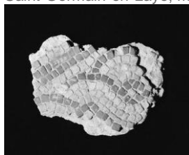
Fragment de mosaïque

Saint-Germain-en-Laye, musée d'Archéologie nationale et Domaine national de Saint-Germain-en-Laye