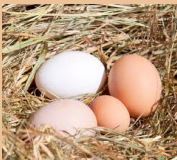
La poule pond des œufs