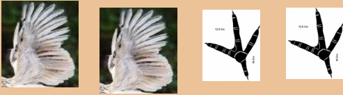
2 ailes et 2 pattes