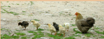
Les poussins cherchent leur nourriture dès leur naissance