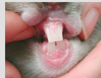
Une bouche et des dents