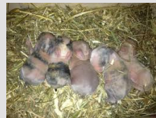
La lapine porte ses bébés dans son ventre