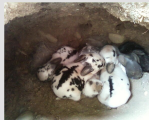
Elle allaite Les lapereaux.