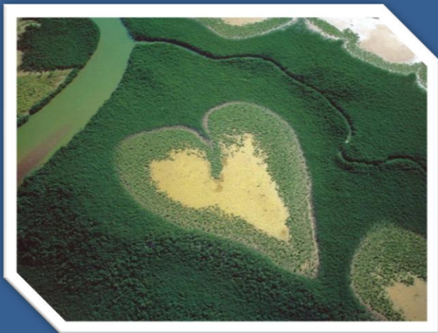
Cœur de Voh, au sud de la Grande Terre