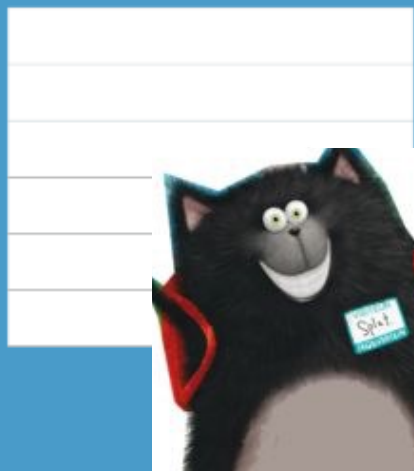
Illustration de Splat : Rob Scotton