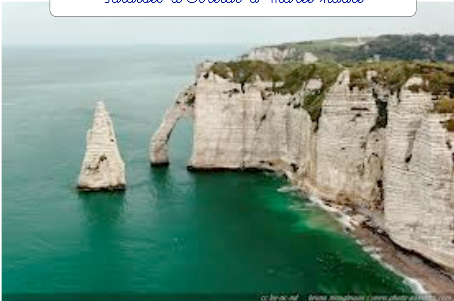
Falaises d'Etretat à marée basse