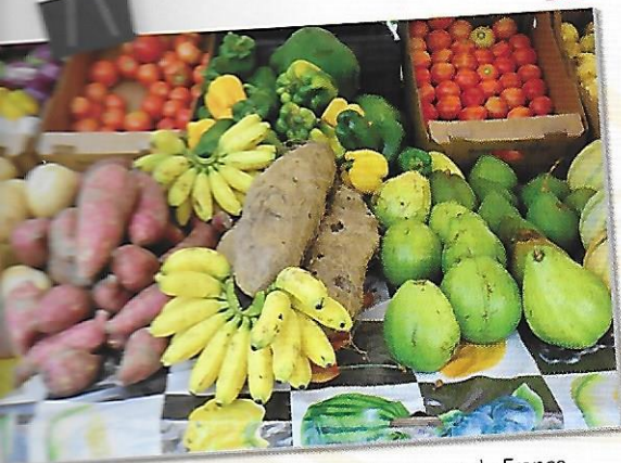
Un étal de fruits tropicaux sur le marché de Fort-de-France

C'est Christophe Colomb qui, au cours de son quatrième voyage à la recherche des Indes (il ignorait qu'il avait en fait trouvé l'Amérique et les Caraïbes), a découvert l'île de la Martinique le 15 juin 1502.