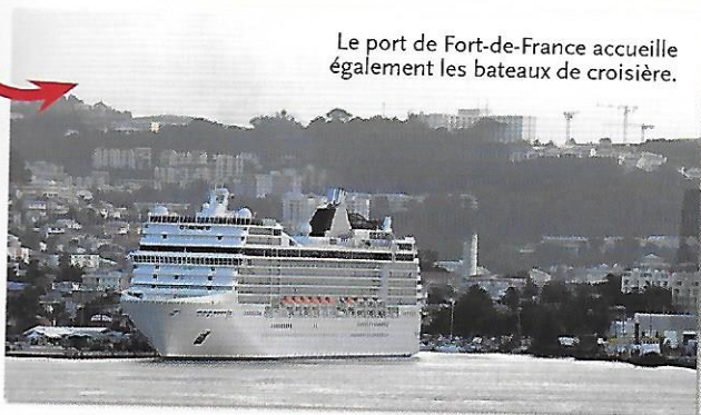
Le port de Fort-de-France accueille également les bateaux de croisière.

Le tourisme est très important pour l'économie martiniquaise. Il rapporte autant que l'agriculture sur l'île et trois fois plus que la banane. Le Sud est la région touristique par excellence.