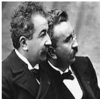
Les Frères Lumière