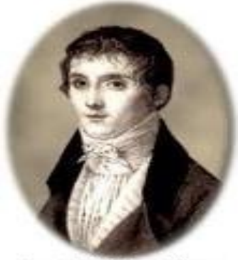
Joseph Nicéphore Niépce (1765-1833)