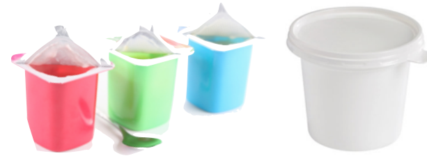
Pots de yaourt et crèmes