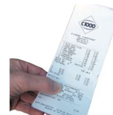
Ticket de caisse