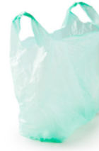
Sac de caisse