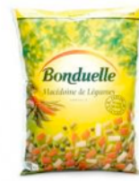
Sachet de surgelé