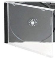
Boite de CD