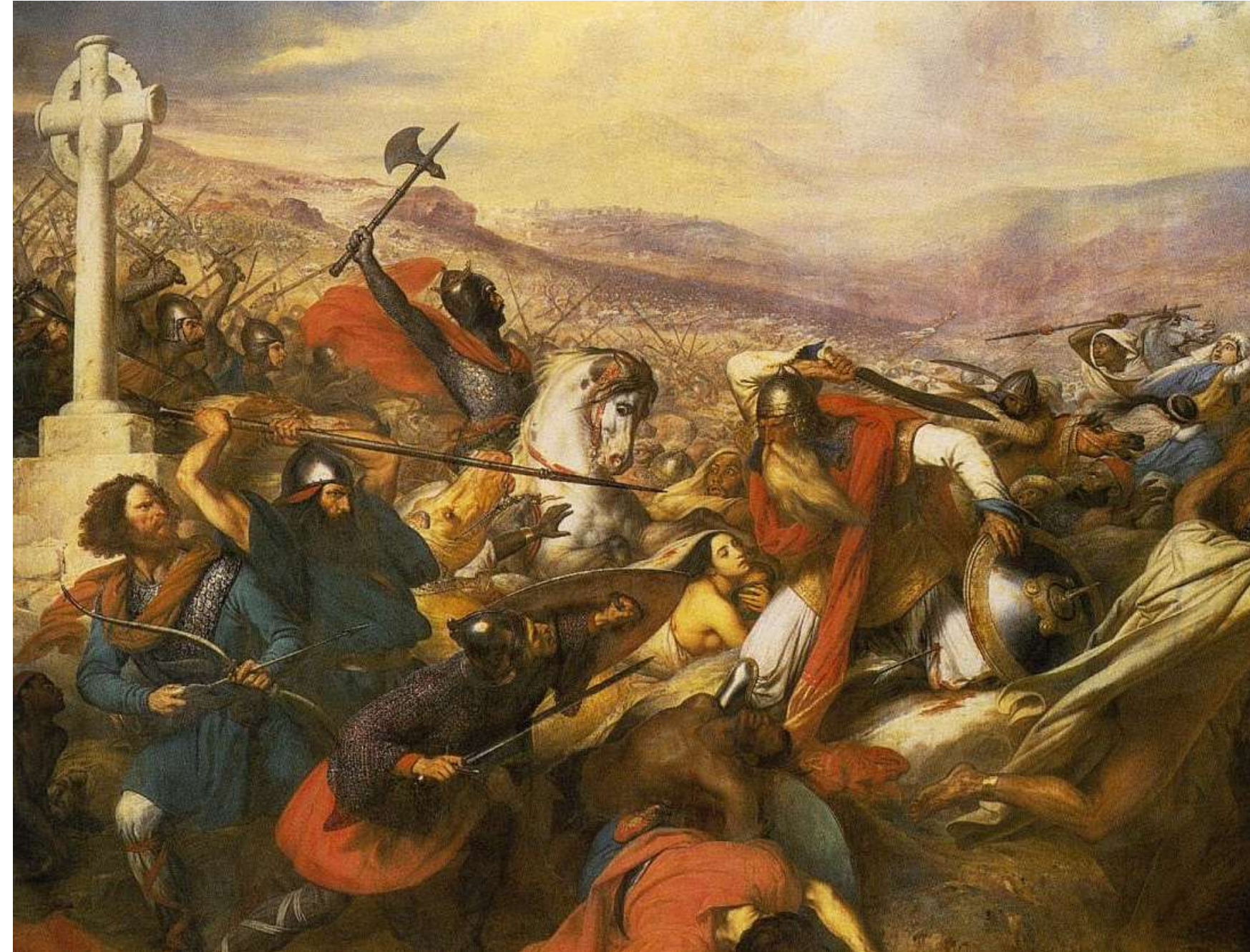
la bataille de Poitiers (732)