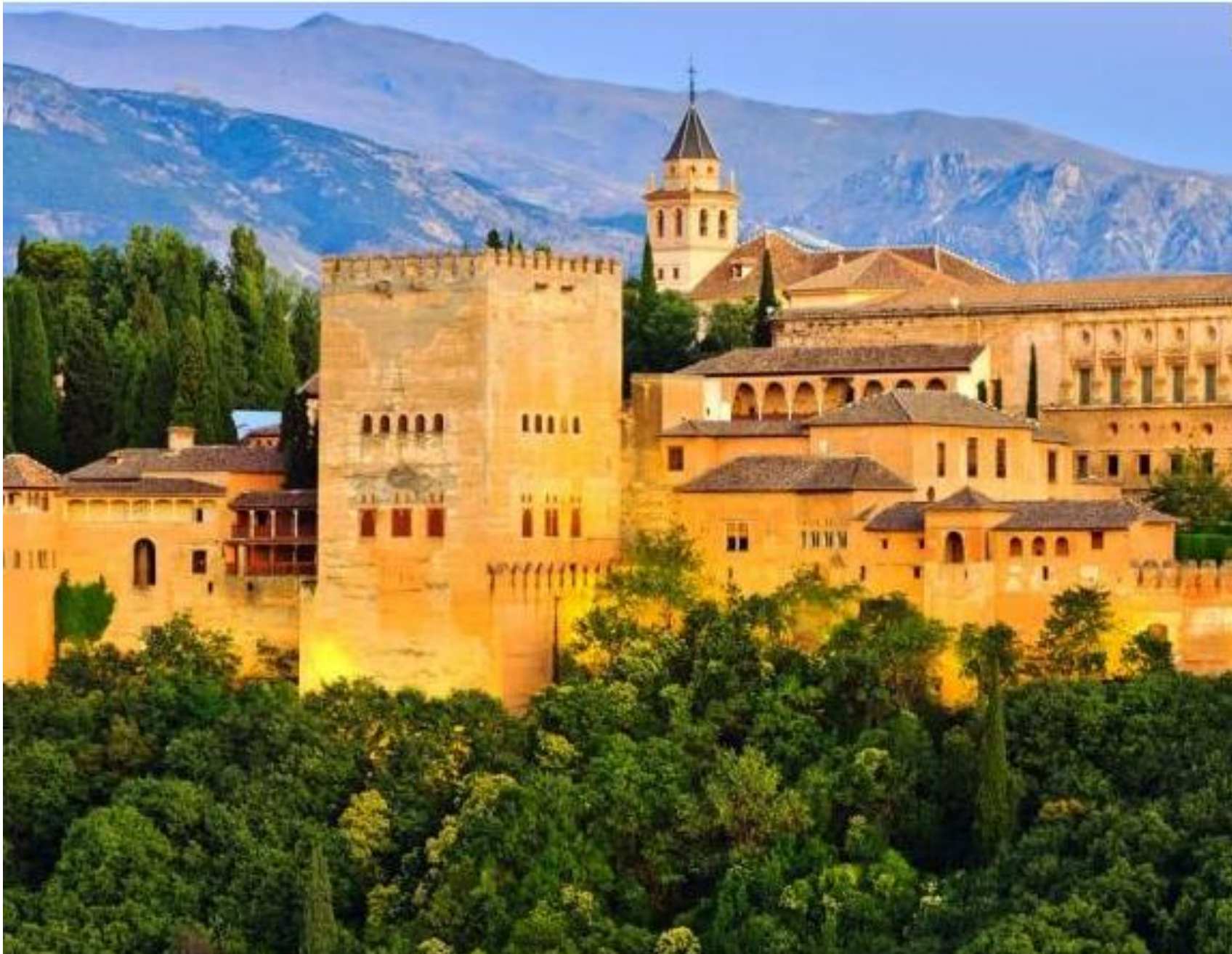
Le palais de l'Alhambra à Grenade