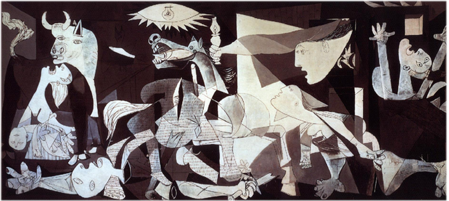
Picasso, Guernica , 1937

Picasso a peint ce tableau pour dénoncer la violence de la guerre civile.