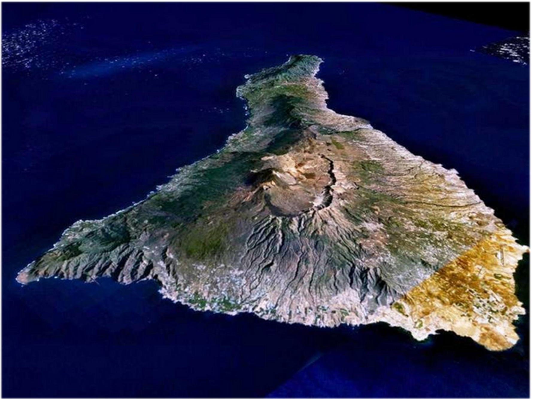
Photo satellite de Tenerife , une des îles Canaries